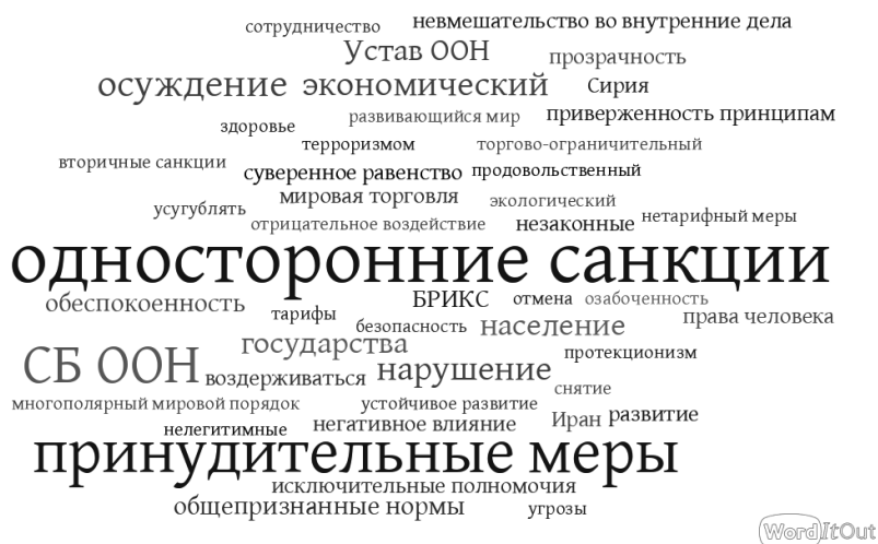
Рис 2. Облако слов: пункты, посвященные санкционным вопросам, в декларациях саммитов БРИКС/БРИКС+

пятствующим развитию государств и их сотрудничеству, но и как углубляющие напряженность между ними 20 .